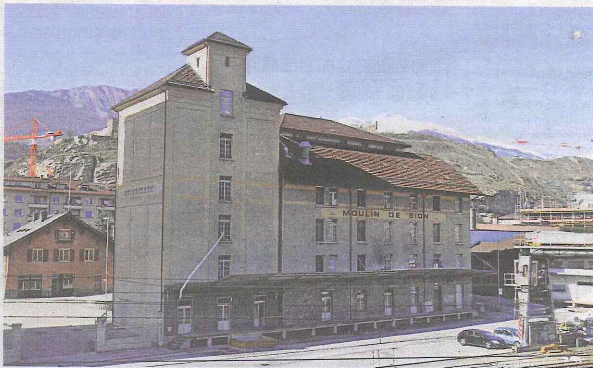
Migros collabore depuis toujours avec le Moulin de Sion, l'un des plus modernes d'Europe.

Les bâtiments se situent à proximité de la gare de Sion. On distingue un imposant silo à grains, dont les trente cellules peuvent accueillir globalement 4000 tonnes de blé. Dans un bâtiment voisin, les céréales sont nettoyées, condi-