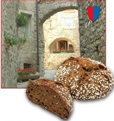
une exclusivité de votre artisan boulanger